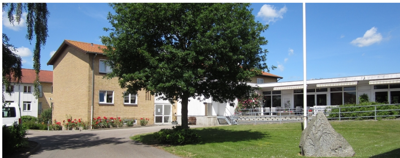
Plejecenter Farsøhthus, Allingåbro

Derudover har Ældrerådets medlemmer deltaget i et seminar med daværende Ældreminister Astrid Krag om den nye ældrelov, hvor Ældrerådet kunne komme med input.