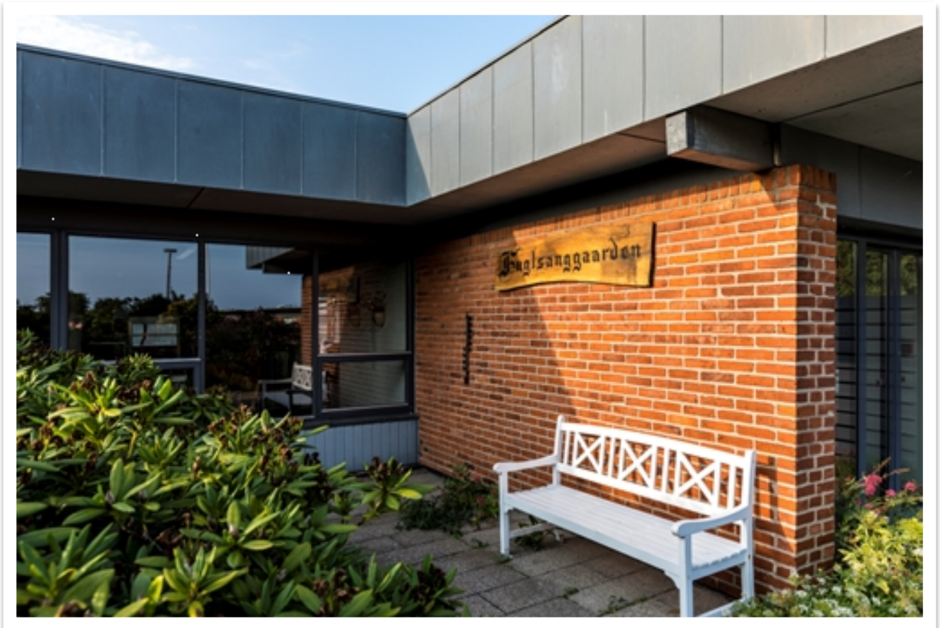
Plejecenter Fuglsanggården, Grenaa

Ældrerådet har indgivet høringsvar angående dette.