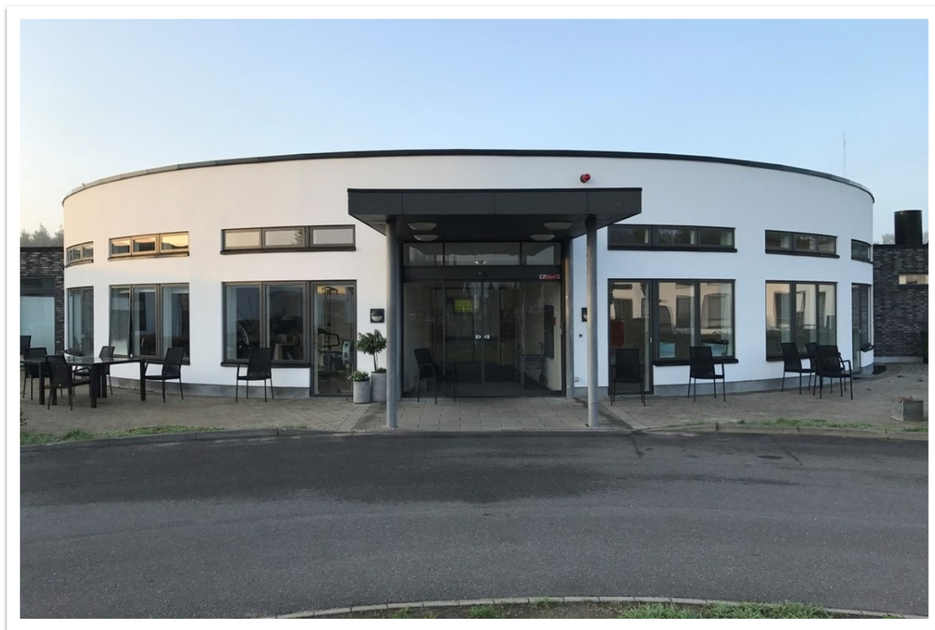
Glesborg Plejecenter, Glesborg

Ældrerådet udarbejdede et konstruktivt høringssvar til besparelserne, hvilket desværre ikke ændrede på beslutningerne.