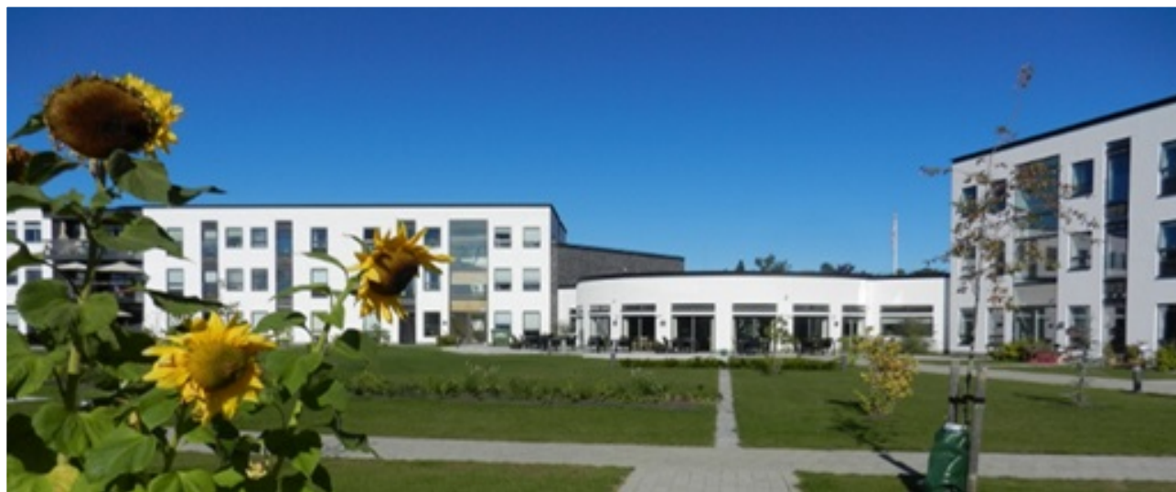
Plejecenter Violskrænten, Grenaa

Ældrerådet har et godt samarbejde med Handicaprådet om de trafikale problematikker, da mange interesser er sammenfaldne.