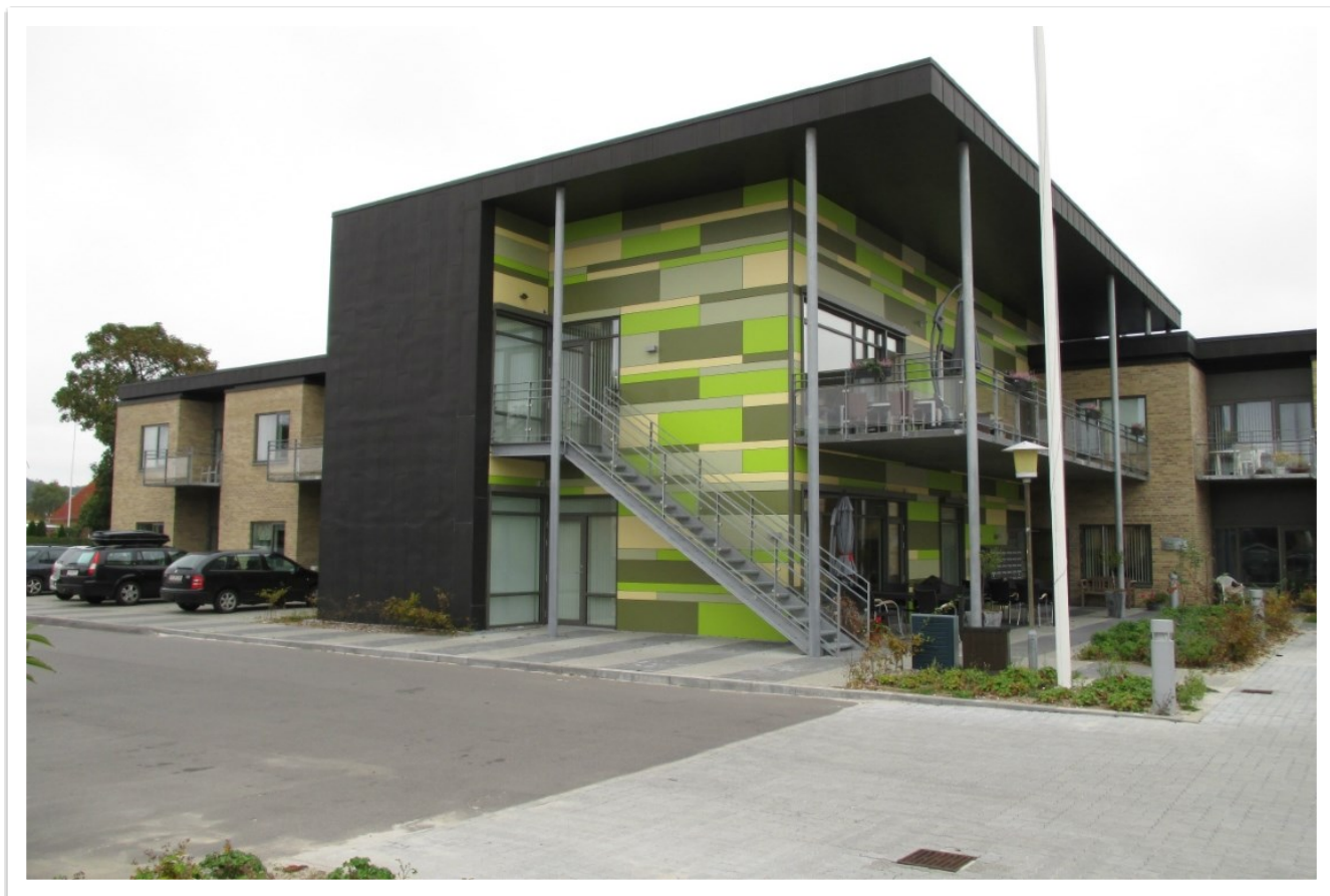
Plejecenter Møllehjemmet, Auning