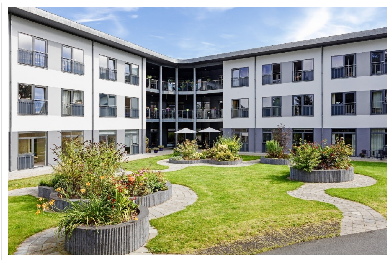
Plejecenter Digterparken, Grenaa

Ældrerådet er kommet godt i gang med arbejdet, og har i det forløbne år haft mange mærkesager.